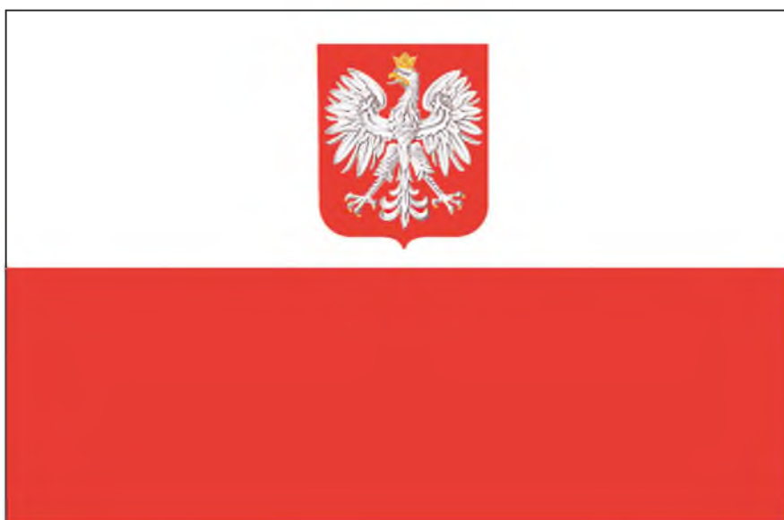
FLAGA PAŃSTWOWA RZECZYPOSPOLITEJ POLSKIEJ

Stosunek wysokości godła do szerokości flagi – wynosi 2:5